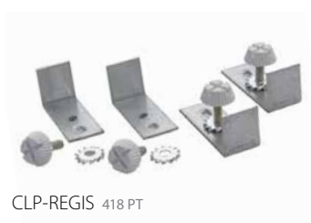
CLP-REGIS 418 PT