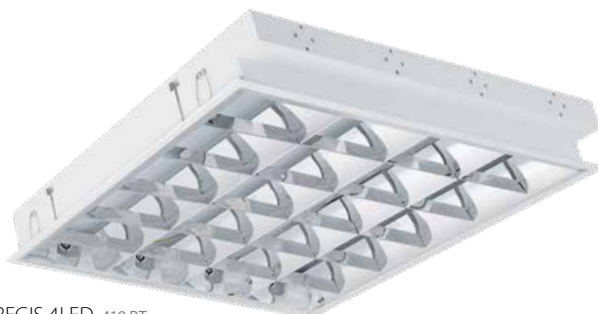
REGIS 4LED 418 PT