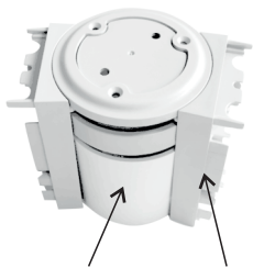
89-1053 + 89-1054 Flexibler Verbindungsblock + Verbindungsstücke