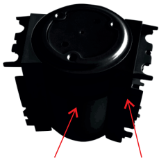
89-1055 + 89-1056 Flexibler Verbindungsblock + Verbindungsstücke